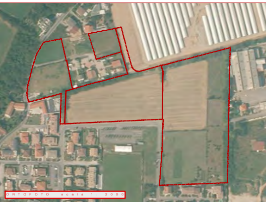
DATA FOTO SCALA 1:2000