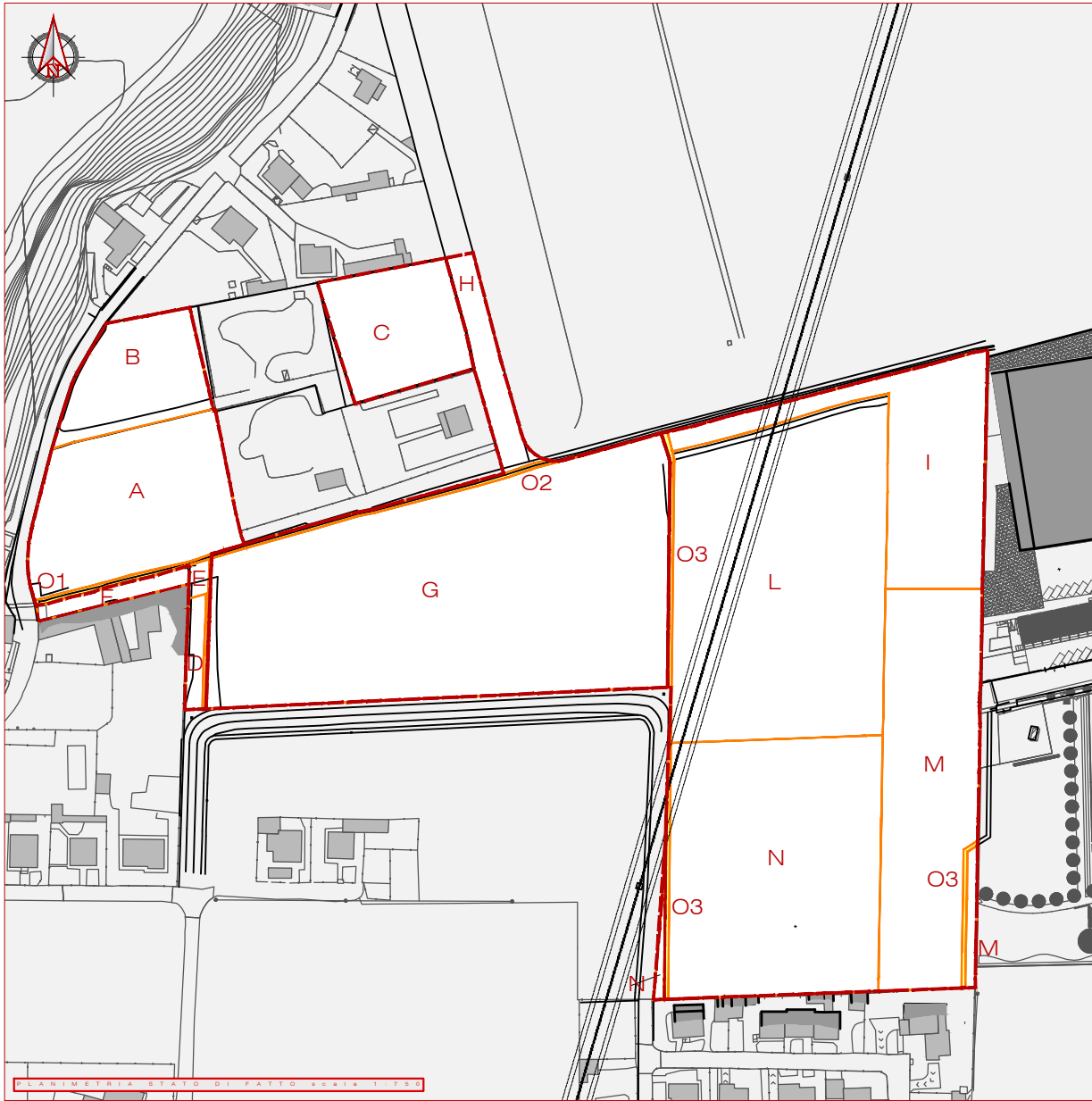
PLANIMETRIA STATO DI FATTO SCALA 1:750

> STUDIO ING. SILVANO ONORI Viale Locatelli 115_24044_Dalmine_BG tel. _ 035 565720 e-mail _ info@studionori.it